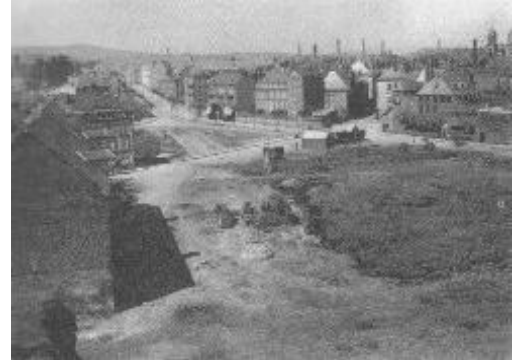
L'emplacement du collège