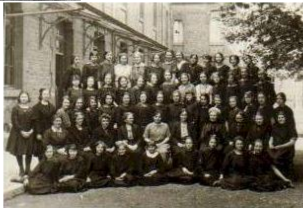
Tous les professeurs et les élèves pendant la guerre.

Le collège ouvre ses portes le 8 octobre 1894. Il accueille 71 élèves, dont 16 pensionnaires ou demi-pensionnaires.