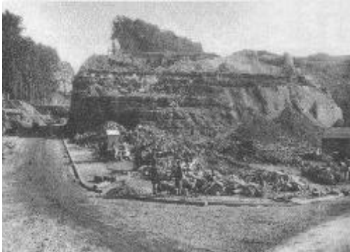
Le bastion en cours de démolition

En 1889, la ville de Sedan décide de la création d'un lycée de jeunes filles à l'emplacement d'un ancien bastion.