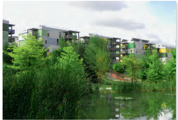
Document 5 • Le jardin des vallons.