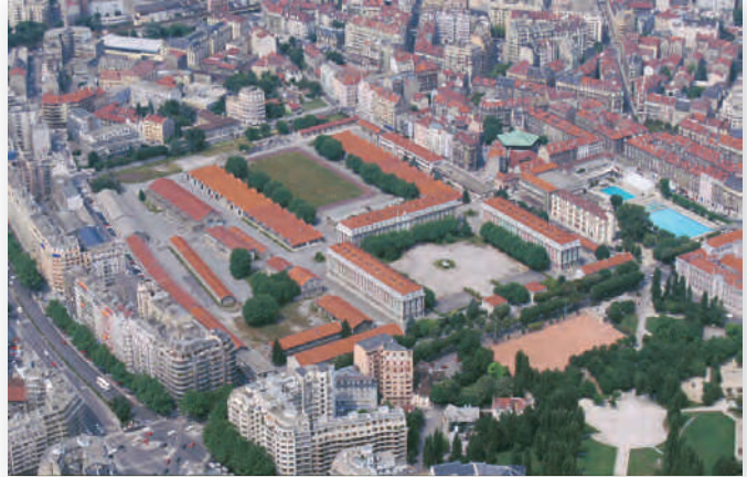
Document 2 • La caserne de Bonne, au centre-ville de Grenoble, avant transformation.