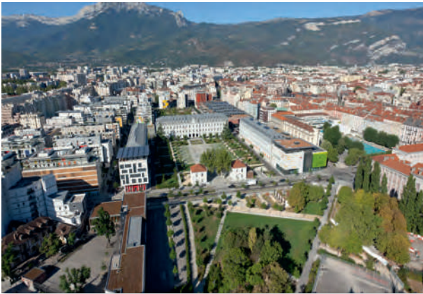
Document 4 • Vue aérienne de Bonne.