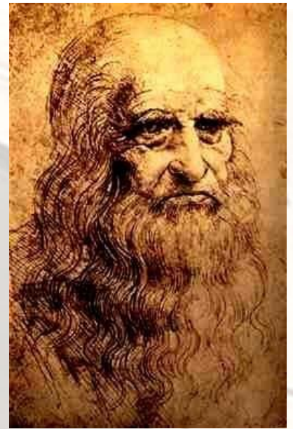
Autoportrait 1512 - 1515

Le 2 mai 1517, il décède à l'âge de 67 ans, au château de Clos-Lucé où il résidait.