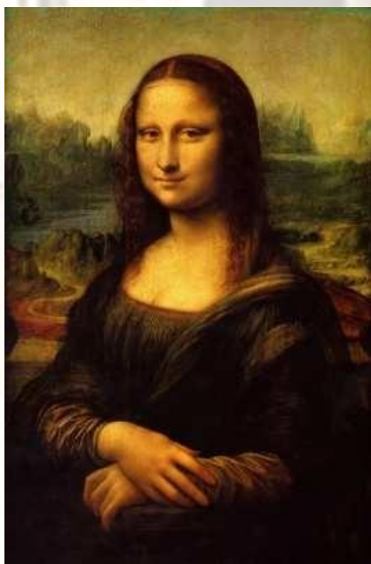
Mona Lisa ou La Joconde peinture sur bois (77x53 cm) 1503 - 1506