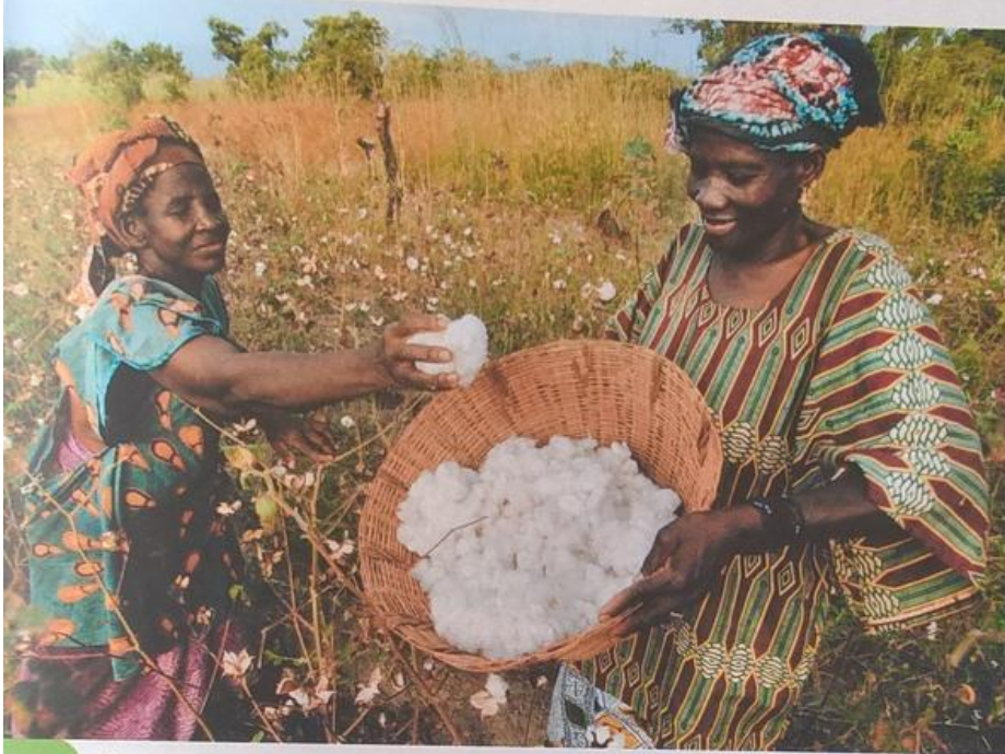
Doc. 1 Champs de coton, au Mali

Regardez bien ces documents et répondez aux questions.