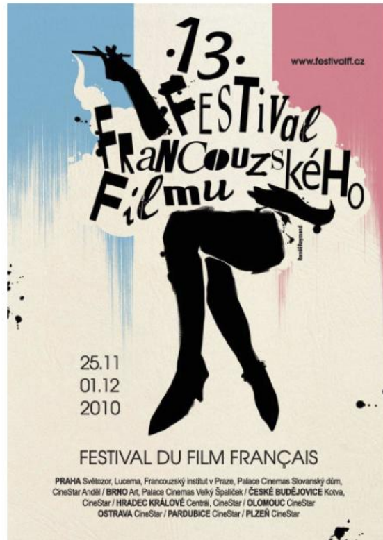
Festival du film français en République tchèque

Tous les pays qui utilisent le français comme langue, se réunissent pour une grande réunion.