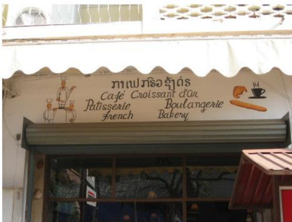
Une boulangerie au Laos

Voici des images des différents endroits du monde dans lesquels on célèbre le fait d'utiliser le français.