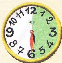
05 : 30 Il est 5 heures et demie.