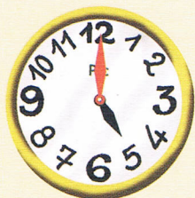
05 : 00 Il est 5 heures.

Voici le déroulement d'une heure. On avance à chaque fois de 15 minutes ou d'un quart d'heure .