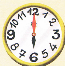
06 : 00 Il est 6 heures.

1 Marque l'heure indiquée en traçant la grande aiguille en vert .