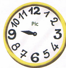
Il est 9 heures et quart.