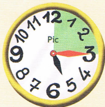
05 : 15 Il est 5 heures et quart.