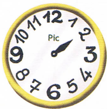
Il est 2 heures moins le quart.