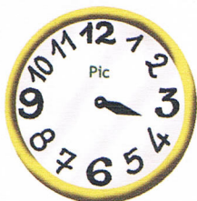
Il est 3 heures et demie.

1 Marque l'heure indiquée en traçant la grande aiguille en vert .