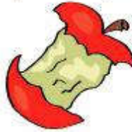
un trognon de pomme