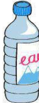
une bouteille en plastique