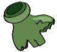
un morceau de verre