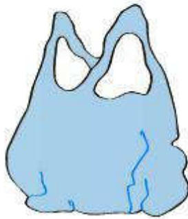
un sac en plastique