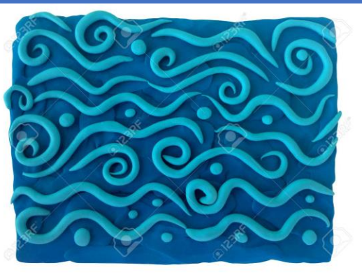
Avec de la pâte à modeler