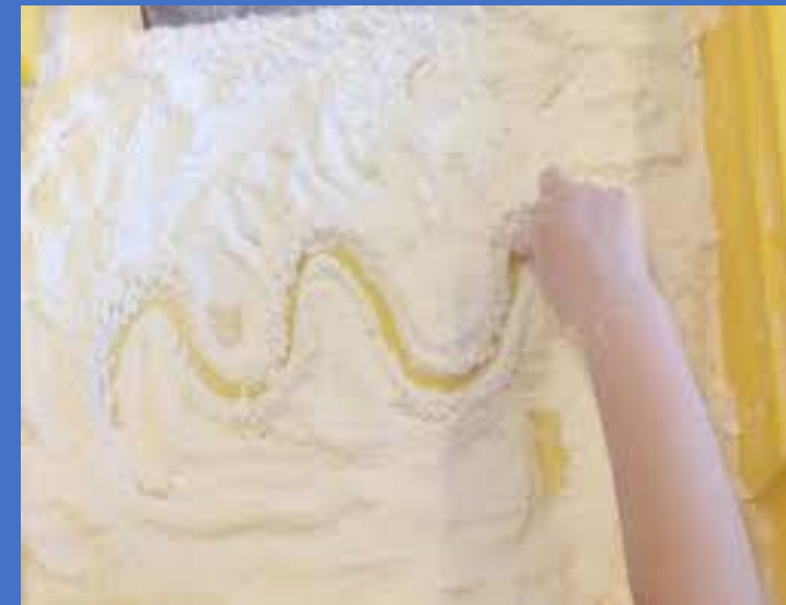
Dans de la farine