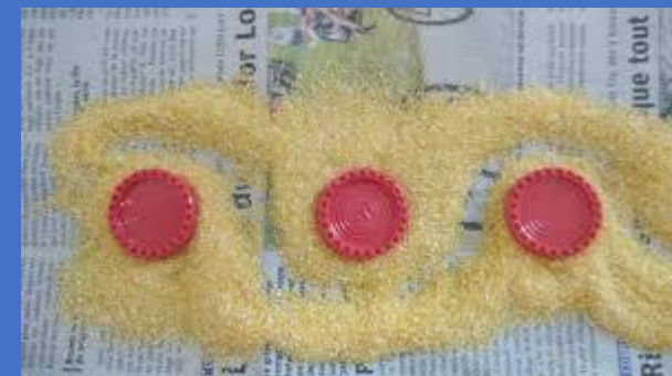
Dans de la semoule