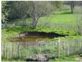
La mare pédagogique