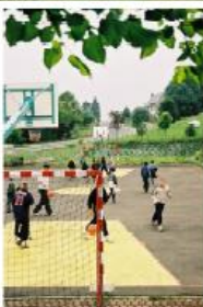
Le terrain de hand / basket