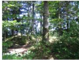
La petit bois