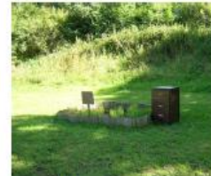
Le jardin aromatique le compost