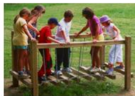
L'aire de jeux