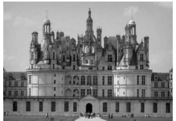
Le Château de .....