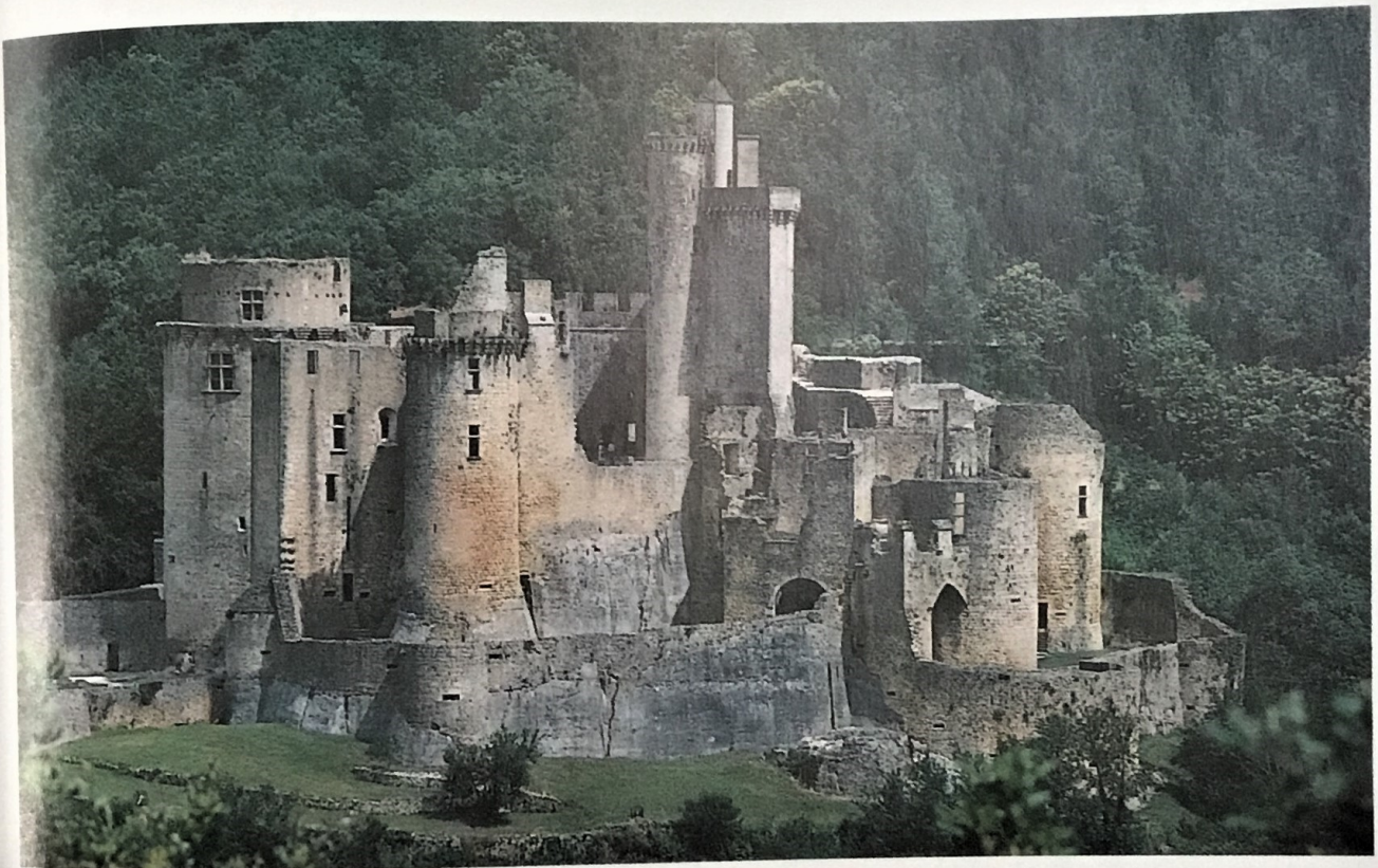
Le château fort de Bonaguil, en Aquitaine.

Au Moyen Âge, les seigneurs construisaient des châteaux forts pour se protéger de leurs ennemis.