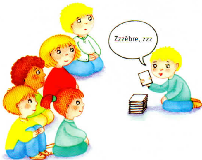
Équipe du phonème S [s].

À tour de rôle, un joueur de chaque équipe retourne un mot-image. S'il contient le phonème de son équipe, il gagne un jeton pour son équipe.