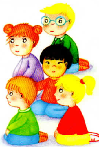
Équipe du phonème Z [z].