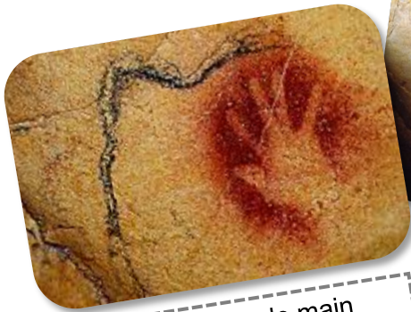
Empreinte de main