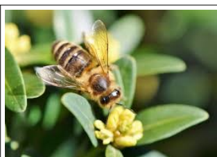
Des abeilles solitaires