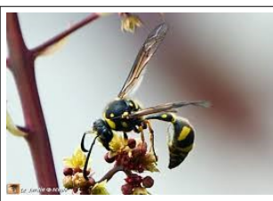
Des guêpes solitaires