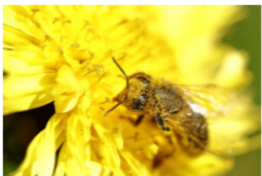
se nourrir sur les fleurs

A chaque changement de couleur, on pointe une colonne différente de l'écritoire. Entre crochets [ ], j'indique la tête de colonne.