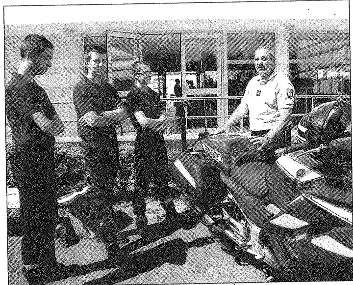
Plus qu'une démonstration, c'est une opération séduction que les gendarmes ont proposé aux lycéens susceptibles de s'orienter vers les métiers de la sécurité et de la protection.