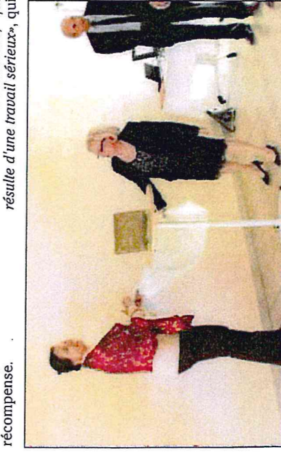
Le lycée bragard Blaise-Pascal a coulé une plaque pour la remise du label à Wassy.