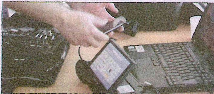
Une mallette bien utile... pour lire les données, même effacées, des téléphones.