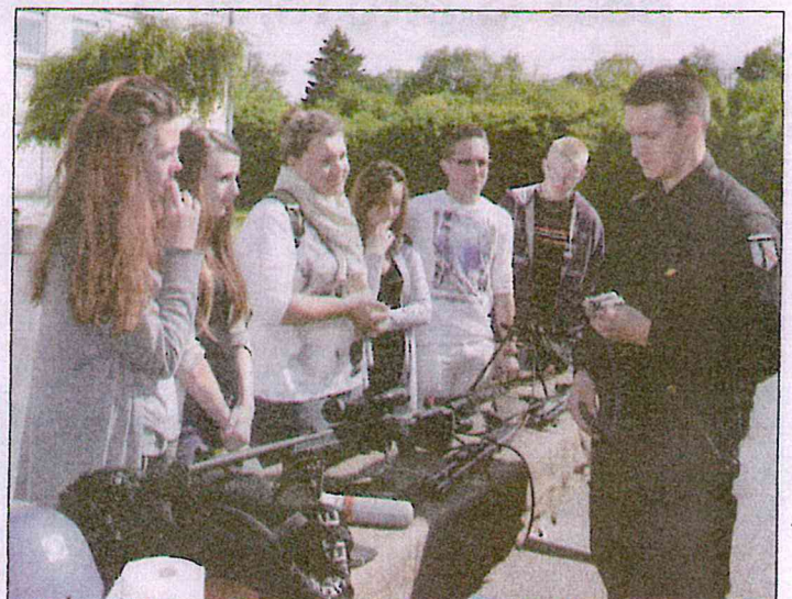
Collégiens et lycéens ont pu découvrir différents métiers de la gendarmerie.

Celui qui pense qu'être habillé en gendarme est chose facile se trompe... lourdement. C'est le cas de le dire. Hier matin, la brigade de Revigny nous a équipés de sa tenue quasi complète, avec les jambières, le gilet pare-balles, les protections bras-épaules, le casque (dont le poids avoisine les 2 kilos), le masque à gaz et le bouclier. Ainsi vêtu, difficile de marcher correctement. Et encore, les militaires doivent parfois porter un gilet plus protecteur, qui pèse tout de même 14 kilos ! En équipement lourd, une tenue pèse entre 25 et 30 kilos... Marcher, courir et bien respirer avec cet attirail exige une condition physique certaine.