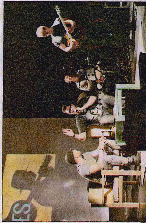
"Peace and Lobe" permet de sensibiliser le public aux risques auditifs.

Dans le cadre du plan de prévention des risques auditifs, le Polca présentait, hier après-midi, le spectacle "Peace and Lobe", à la MJC. Deux cents collégiens et lycéens de Saint-Dizier, Wassy et Joinville ont ainsi été sensibilisés aux dangers pour leurs oreilles.