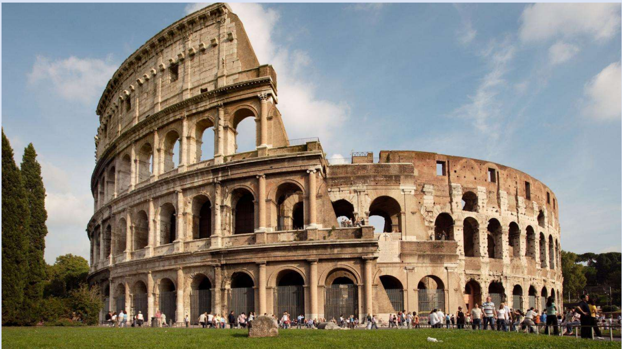
[ https://trousseaprojets.fr/projet/2598-a-la-decouverte-de-la-rome-antique-et-moderne ]