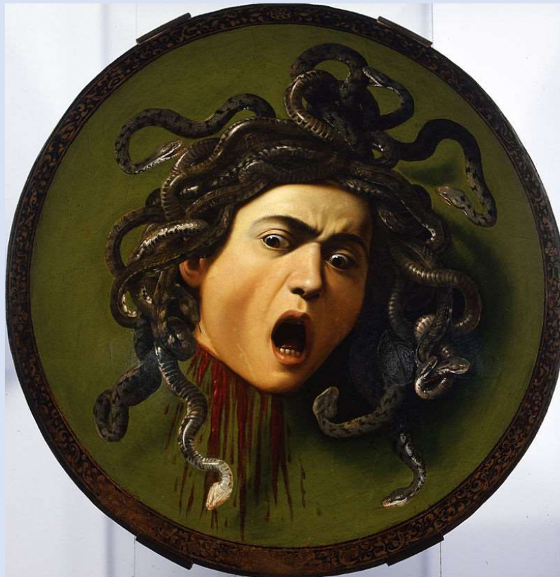
[Le Caravage, Tête de Méduse , 1598, Florence, Galerie des Offices ]