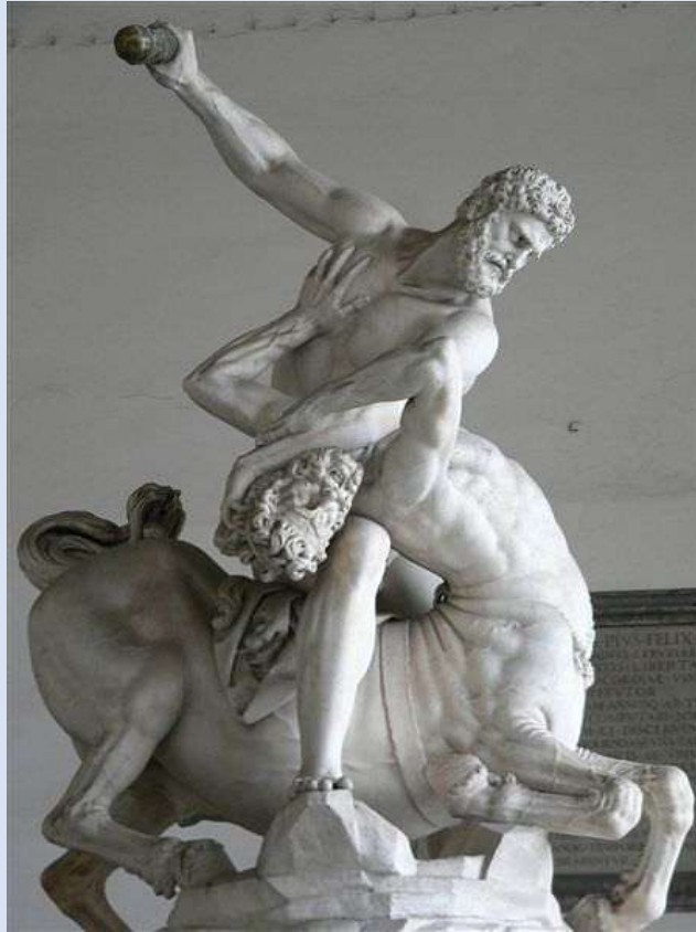
[ Jean de Bologne, Hercule en lutte contre le Centaure Nessus , 1549-1599, Florence]

Saurez-vous reconnaître ces figures mythologiques ?