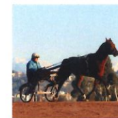
Lad jockey Lad driver