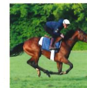
Cavalier d'entraînement professionnel