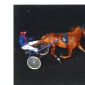
Driver Jockey de trot