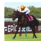
Jockey de galop