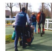
Responsable de voyage