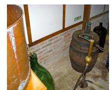
Cuve , tonneau et dame-jeanne

Nous entrons dans le bâtiment par une porte-cochère. A notre gauche se trouve l'habitation . Dans son prolongement , on a une pièce où étaient les cuves . Les salles adjacentes sont celles de la ferme car ces brasseurs-là étaient aussi fermiers : on a une écurie , une étable et un espace charretier. Dans la cave , on stockait les tonneaux . Le grenier permettait de faire sécher l'orge , d'où la forme spéciale de la cheminée-girouette qui permettait d'évacuer l'humidité et d'éviter que les pluies ne tombent dans la pièce . Avec le crochet , on remontait les sacs .