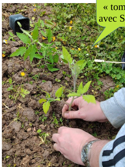
Atelier « tomate » avec Samuel

C'est le moment de mettre la main à la pâte et les pieds dans la boue !!