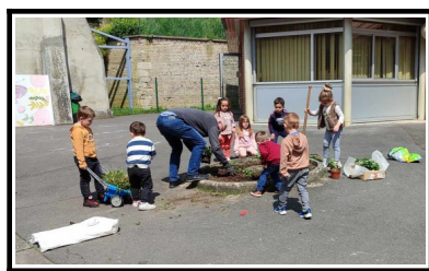
Tout le monde s'y met !