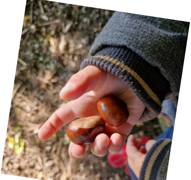
Un marronnier, qui donne des marrons.