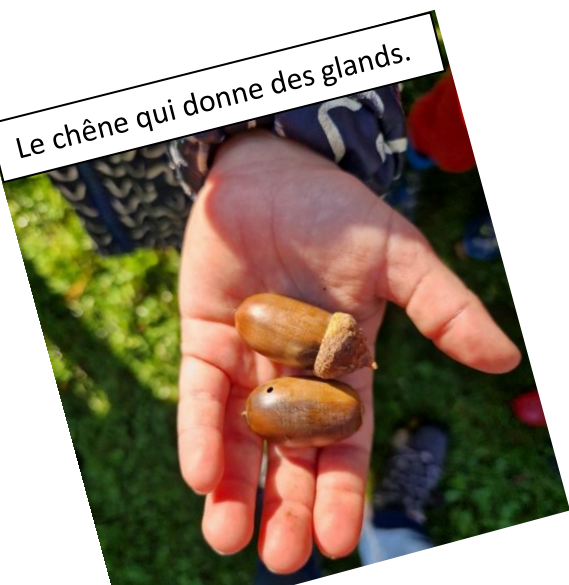
Le chêne qui donne des glands.