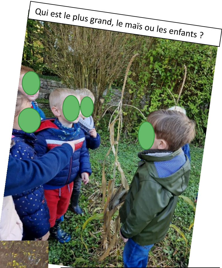
Qui est le plus grand, le maïs ou les enfants ?