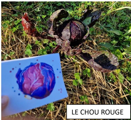
LE CHOU ROUGE