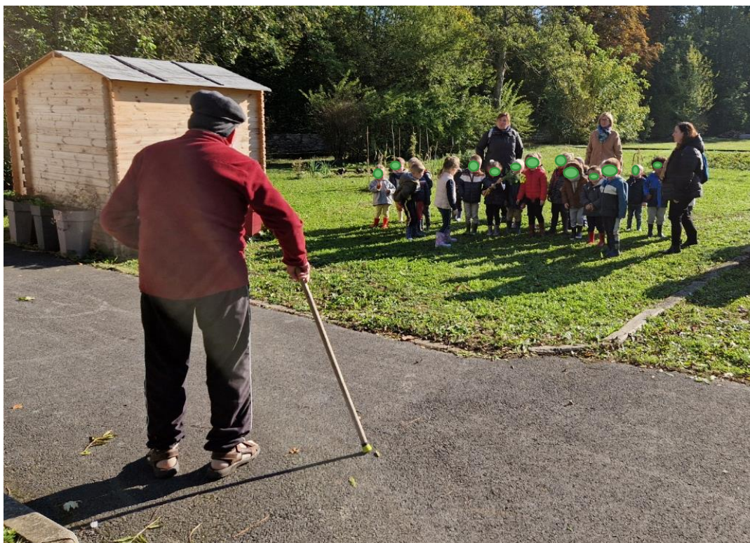
Avant de repartir, Monsieur L. est venu nous saluer. Nous étions heureux de nous retrouver.