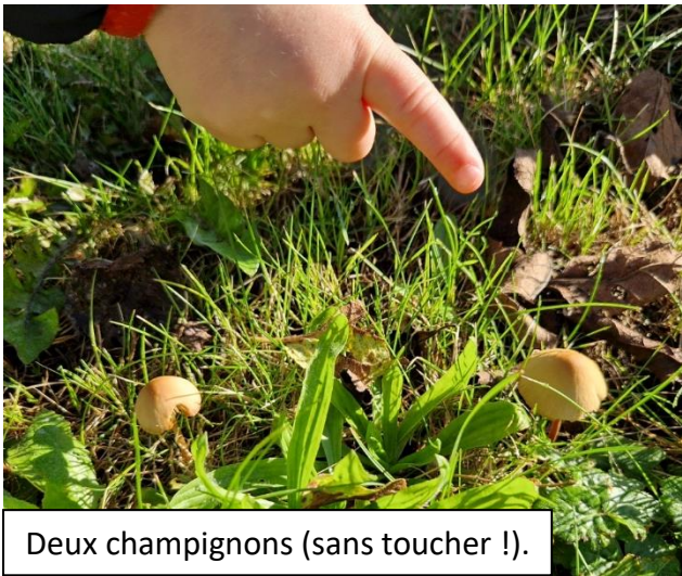
Deux champignons (sans toucher !).