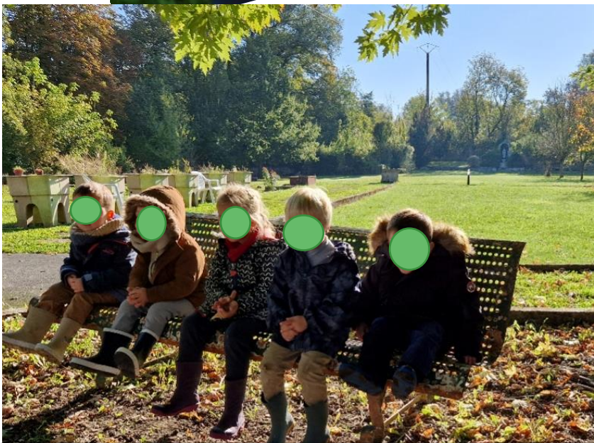
Nous nous sommes rassemblés pour partager nos trouvailles.