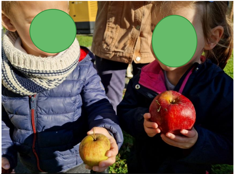
Un pommier, qui donne des pommes.