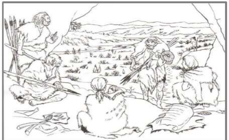
Doc.3. Scène de vie des hommes de Tautavel (reconstitution)

D'après cette reconstitution, l'homme de Tautavel connaissait-il le feu ?