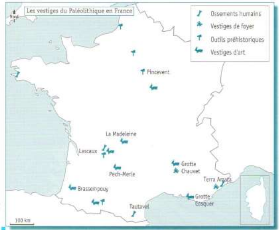
Doc.1. Les vestiges du Paléolithique en France

Les fossiles humains retrouvés sur le site montrent que des hommes y ont vécu il y a 450 000 ans.