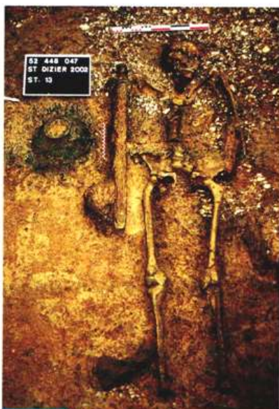
Doc. 1 Tombe mérovingienne, VI e siècle

Observe attentivement tous les documents