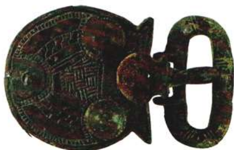
Doc. 3 Boucle de ceinture, V e siècle

Retrouvée dans la nécropole de Sainte-Fontaine. MUDO. Musée de l'Oise, Beauvais.