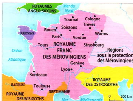
Doc. 6 Carte de l'implantation des Mérovingiens au VI e siècle

Bâtiment mis à jour à Pratz. Restitution proposée par les archéologues.