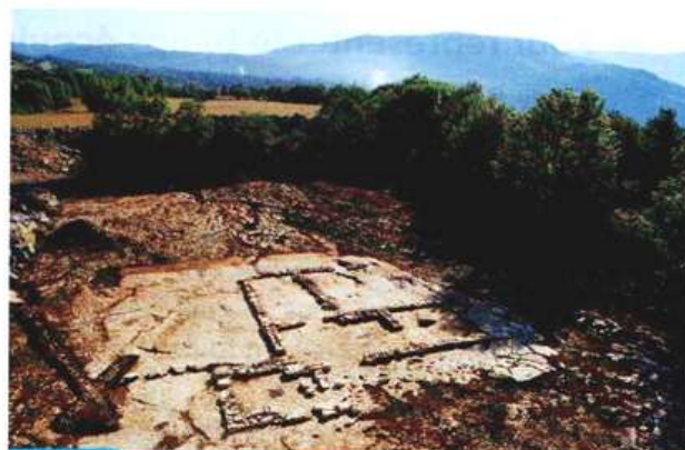
Doc. 4 Restes d'un bâtiment résidentiel de l'époque mérovingienne, VII e siècle

Retrouvée dans la nécropole de Sainte-Fontaine. MUDO. Musée de l'Oise, Beauvais.