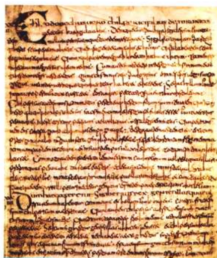
Doc. 2 Grégoire de Tours, Histoires , copie du VII e siècle, manuscrit mérovingien

Mise à jour lors des fouilles archéologiques menées à Saint-Dizier (Haute-Marne), 2002.