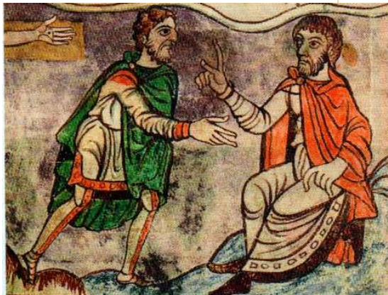
Manuscrit enluminé du IX ème siècle, détail. Württembergische Landesbibliothek, Stuttgart.

Pour contrôler cet empire immense, Charlemagne confie l' administration des régions aux comtes. Ces hommes sûrs représentent l'empereur pour faire appliquer les lois, rendre la justice, prélever les impôts et défendre le territoire.