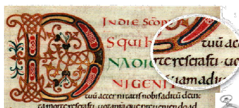
Écriture caroline du 9 ème siècle

Une nouvelle écriture, la caroline , est adoptée. Elle favorise la diffusion des textes et des lois. Les manuscrits sont copiés et enluminés* .