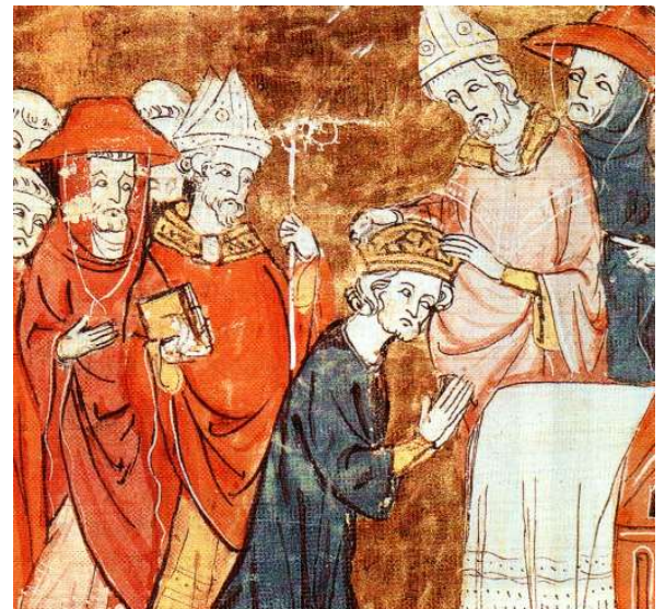
Charlemagne, couronné empereur par le pape à Rome en l'an 800.