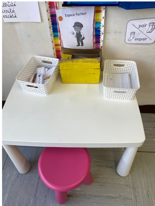
L'espace à scénario du facteur