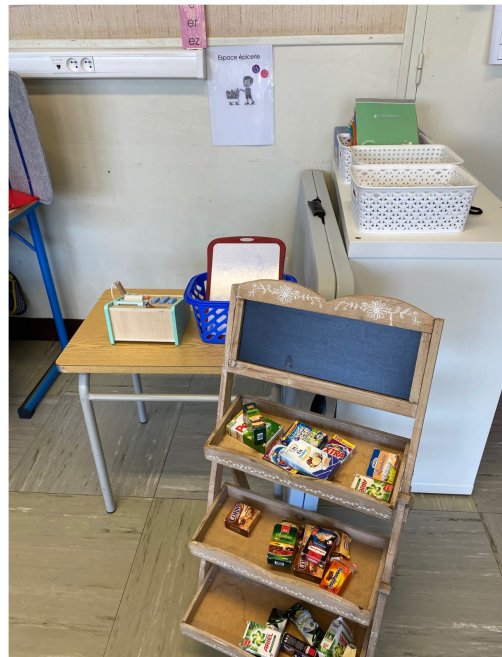
L'espace à scénario épicerie