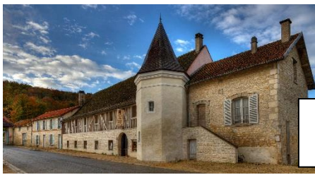
L'Abbaye de Clairvaux