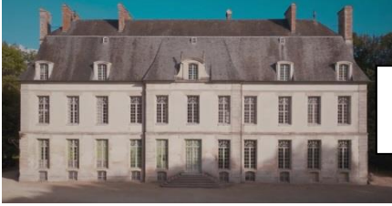
Le château de Dampierre