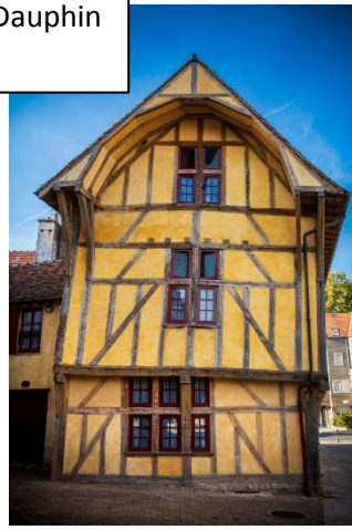
La maison du Dauphin 1472